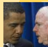
Barack Obama y John McCain

ahora que el senador estadounidense Barack Obama tiene la plataforma del partido Demócrata para postular a la presidencia de su país, empezó a recorrer estados clave como Missouri y Florida, con la esperanza de ganar apoyo para su campaña. Su discurso se centra en la delicada situación económica de EE.UU. y sus ataques se dirigen a la política económica de su rival McCain, ligándola a la del actual presidente. McCain respondió señalando que mientras las familias están siendo afectadas por la crisis financiera, Obama ha prometido elevar impuestos.